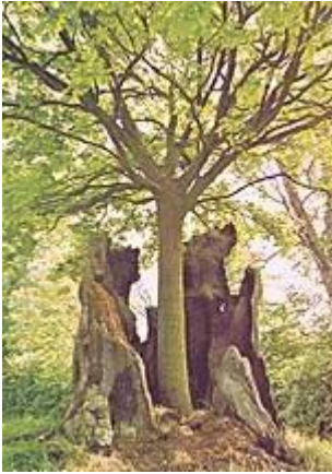
Leven uit de dood

Uitwerking - De uitwerking van deze groeiprincipes vloeit voort uit onze gemeenschap met de Heer Jezus. Het proces van ontwikkeling gaat traag, grondig en is levenslang - zelfs eeuwig - met geen ruimte voor ontwijking of kortsluiting. De Heilige Geest bedient het ware leven van de Heer Jezus binnenin ons - het kan niet anders. "Want wij, die leven, worden altijd in de dood overgegeven om Jezus' wil; opdat ook het leven van Jezus in ons sterfelijk vlees zou geopenbaard worden. Zo dan, de dood werkt wel in ons, maar het leven in u." 2 Korinthiërs 4: 11, 12