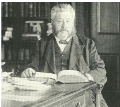
Charles Haddon Spurgeon.

Wij willen tot onze God bidden, zowel met het oog op onze dagelijkse bezigheden, als op de zaligheid van onze ziel. Wij willen even goed op Hem vertrouwen met betrekking op onze boerderij, en onze knolrapen, en onze koeien, als met het oog op onze geestelijke voorrechten en onze hoop op de hemel. De Heere Heere is de God van ons huis. Jezus is onze Broeder, geboren voor tegenspoed, en de Heilige Geest is onze Trooster in elk uur van beproeving. Wij hebben geen ongenaakbare God. Hij hoort, Hij heeft medelijden, Hij helpt. Laten wij op Hem vertrouwen zonder onderbreking, zonder twijfel, zonder aarzeling. Het leven van het geloof is een leven binnen de enge poort van God. Als wij tot nu toe bevend hebben buiten gestaan in de wijde wereld van ongelooft, moge de Heilige Geest ons dan nu ertoe in staat stellen de grote, beslissende stap te doen, en te zeggen, eens en voor altijd: "Heere, ik geloof, kom mijn ongelooft te hulp."